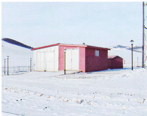
Техник дундын үйлчилгээний төв